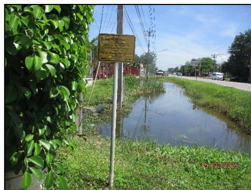
ภาพถ่ายที่ 1.4-1 สภาพพื้นที่โดยรอบโครงการ